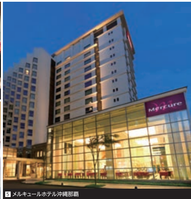
5 メルキュールホテル沖縄那覇