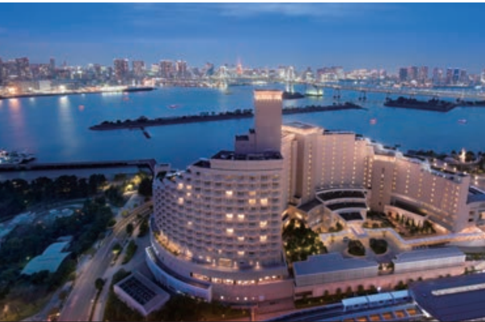
1 ヒルトン東京お台場 NEW