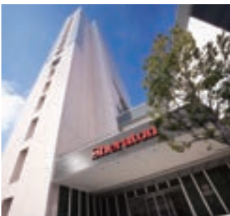
12 シェラトングランドホテル広島