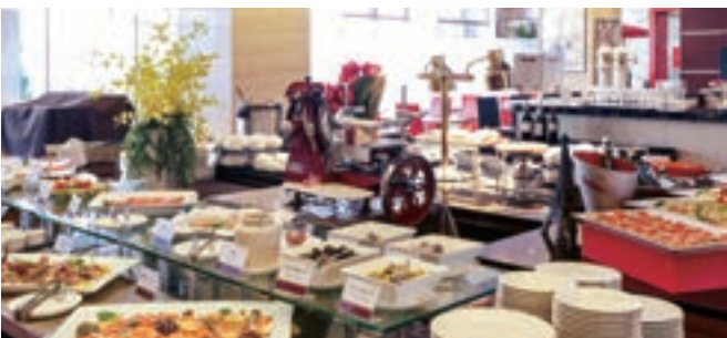
2 ボルドー(メルキュールホテル札幌)