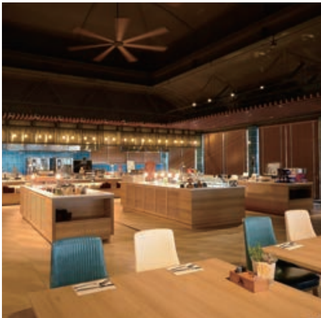
7 BUFFET&GRILL QWACHI(オキナワ マリオット リゾート&スパ)