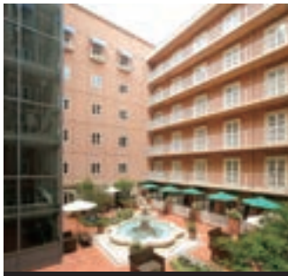
5 なんばオリエンタルホテル