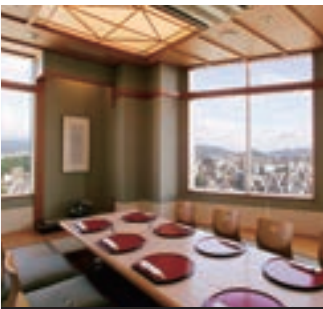
5 みつき(オリエンタルホテル広島)