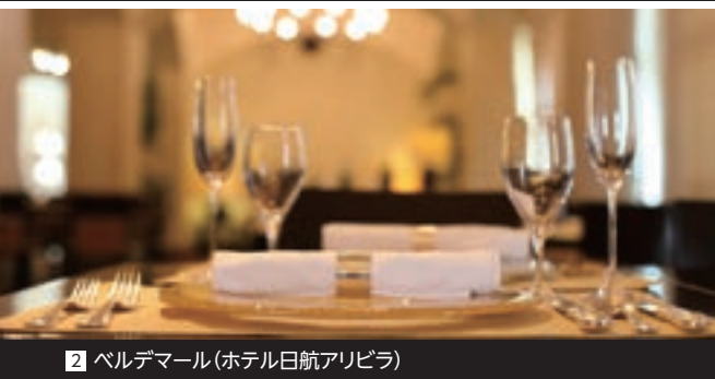
2 ペルデマール(ホテル日航アリビラ)