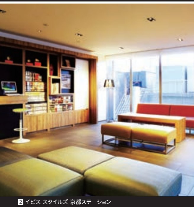
2 イビス スタイルズ 京都ステーション