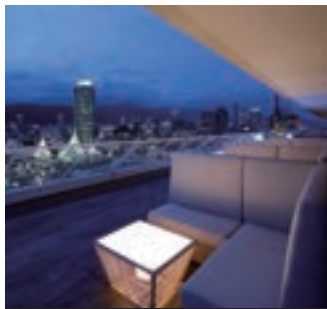
6 VIEW BAR(神戸メリケンパークオリエンタルホテル)