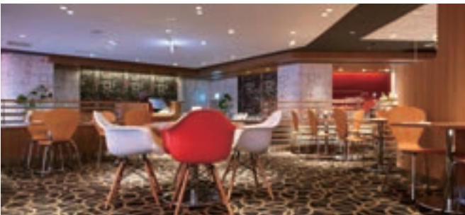
1 カフェ ランデヴー(イビス東京新宿) NEW