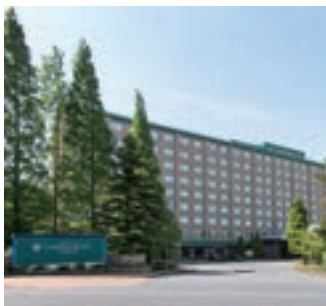
13 インターナショナルガーデンホテル成田