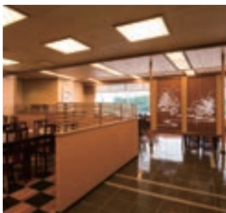
10 松風(ヒルトン成田)