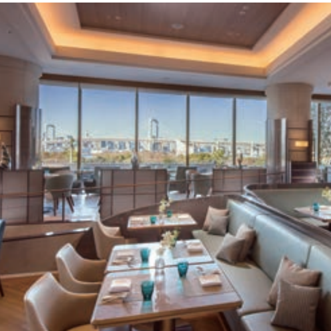
1 シースコープ(ヒルトン東京お台場) NEW