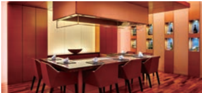
4 雅庭(シェラトングランドホテル広島)

1 ヒルトン東京お台場 シースコープ テラス・ダイニング<オールデイダイニング> グリロジー パー&グリル<グリル料理> 日本料理 さくら<会席、鉄板焼、寿司、天ぷら> 中国料理 唐宮(とうぐう)<広東料理> キャプテンズバー<バー> 2 ホテル日航アリビラ ペルデマール<ブラスリー> 佐和(さわ)<日本料理・琉球料理> 金紗沙(きんしゃさ)<中国料理> 護佐丸(ごさまる)<鉄板焼> ハナハナ<カジュアルブッフェ> アリアカラ<ラウンジ> ソル (註1) <ビーチバーベキュー> 3 オリエンタルホテル 東京ベイ グランサンク<洋食ブッフェレストラン> チャイニーズ・テーブル<中国料理> 美浜(みはま)<日本料理> ブローニュの森<バー・ラウンジ> フェスタ<カラオケルーム> 4 シェラトングランドホテル広島 ブリッジ<ブッフェレストラン> 雅庭(みやびてい)<日本食>