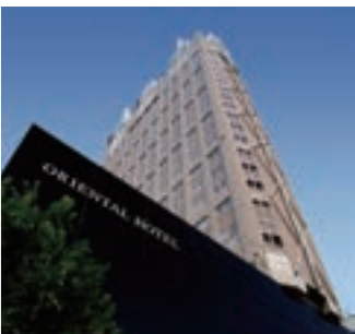
11 オリエンタルホテル広島