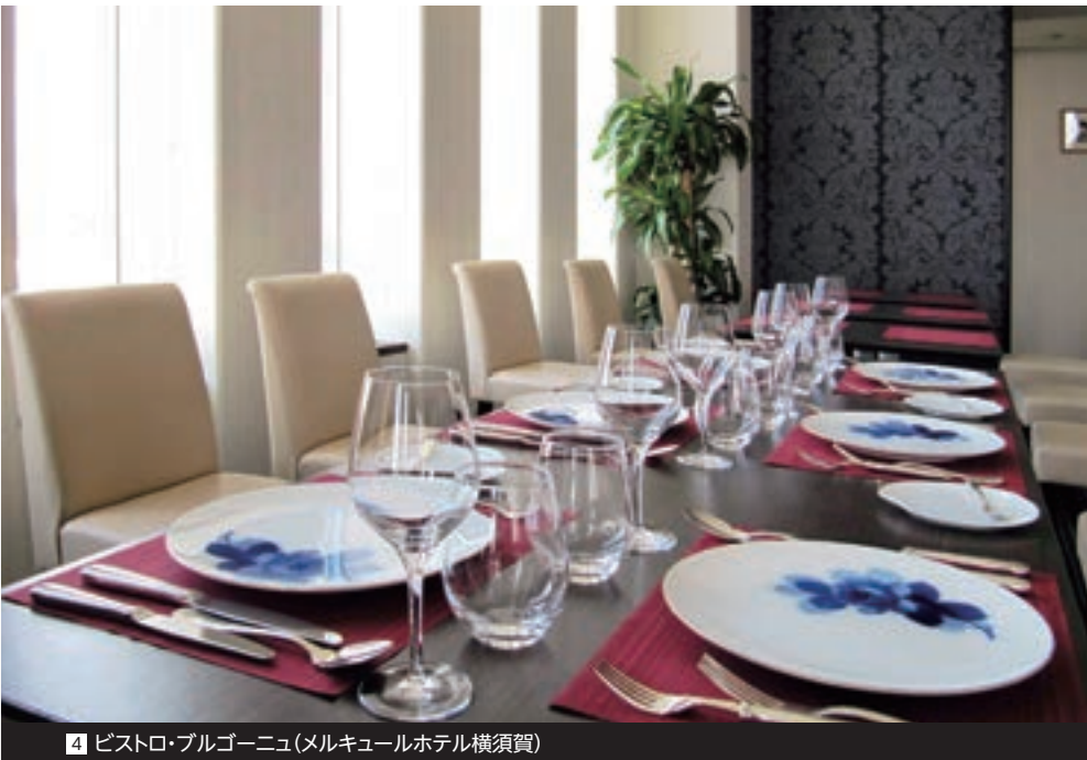
4 ビストロ・ブルゴーニュ(メルキュールホテル横須賀)