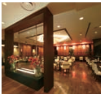
9 珠江(ホテル日航奈良)