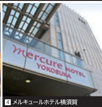
4 メルキュールホテル横須賀