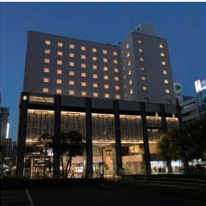
7 オリエンタルホテル福岡 博多ステーション