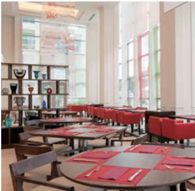
3 ビストロ・ドゥ ラ メール(メルキュールホテル沖縄那覇) NEW