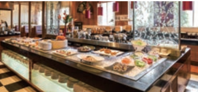
3 チャイニーズ・テーブル(オリエンタルホテル 東京ベイ)

1 ヒルトン東京お台場 シースコープ テラス・ダイニング<オールデイダイニング> グリロジー パー&グリル<グリル料理> 日本料理 さくら<会席、鉄板焼、寿司、天ぷら> 中国料理 唐宮(とうぐう)<広東料理> キャプテンズバー<バー> 2 ホテル日航アリビラ ペルデマール<ブラスリー> 佐和(さわ)<日本料理・琉球料理> 金紗沙(きんしゃさ)<中国料理> 護佐丸(ごさまる)<鉄板焼> ハナハナ<カジュアルブッフェ> アリアカラ<ラウンジ> ソル (註1) <ビーチバーベキュー> 3 オリエンタルホテル 東京ベイ グランサンク<洋食ブッフェレストラン> チャイニーズ・テーブル<中国料理> 美浜(みはま)<日本料理> ブローニュの森<バー・ラウンジ> フェスタ<カラオケルーム> 4 シェラトングランドホテル広島 ブリッジ<ブッフェレストラン> 雅庭(みやびてい)<日本食>