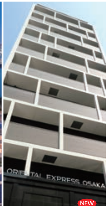
2 ホテルオリエンタルエクスプレス大阪心斎橋 NEW