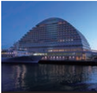
3 神戸メリケンパークオリエンタルホテル