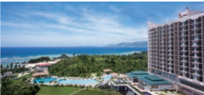
8 オキナワ マリオット リゾート & スパ