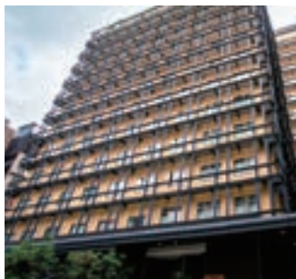
14 ホリデイ・イン大阪難波