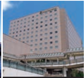
4 オリエンタルホテル 東京ベイ