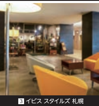
3 イビス スタイルズ 札幌