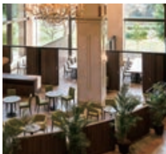
11 AVANTI(インターナショナルガーデンホテル成田)